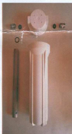
マナウォーターキット